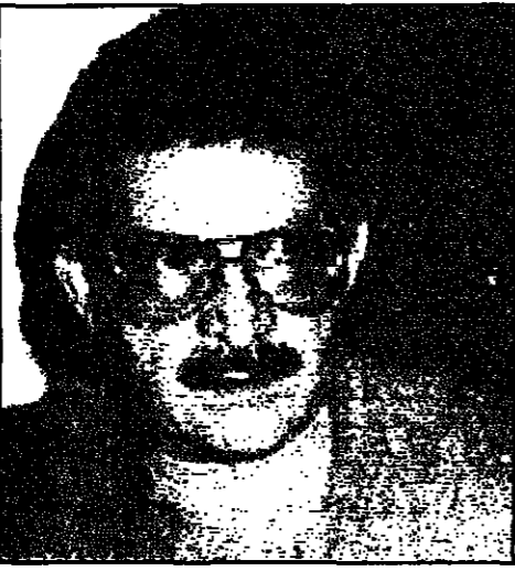
دمشق - من كتبه الجيوش